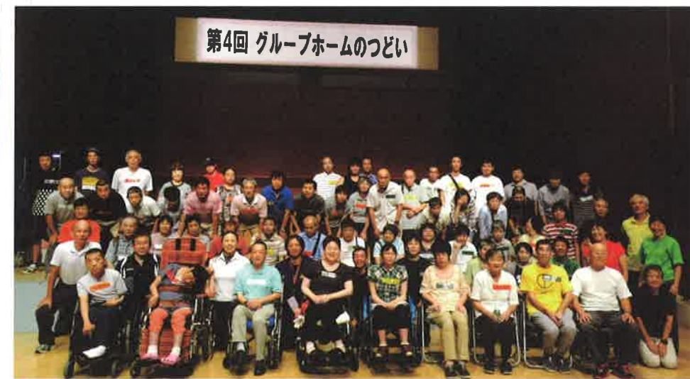
第4回 グループホームのつどい