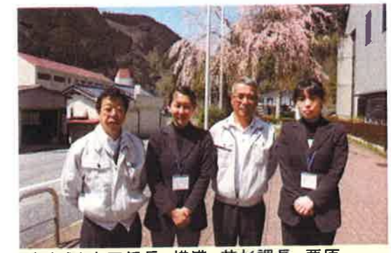
(左から)木田係長、横溝、若杉課長、栗原