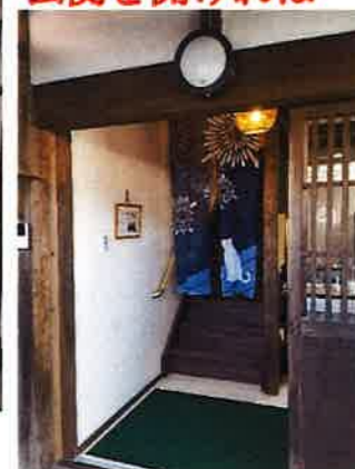
げんかん あ 玄関を開ければ...