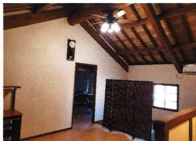
かい 2階のスペース