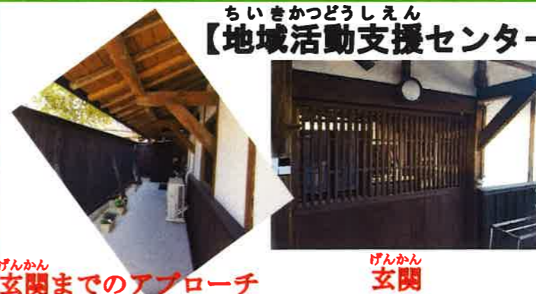
げんかん 玄関までのアプローチ