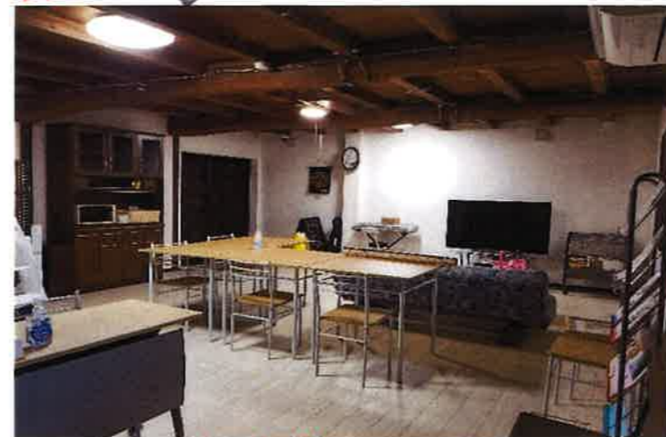
かい かつどう 1階の活動ルーム