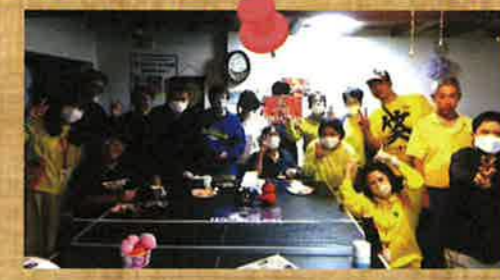
きいろんデイ★ 黄色を身につけ