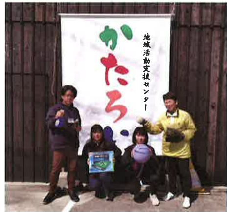
おおつば いちやま おおが うしじま 大坪・市山・大賀・牛嶋